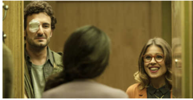
El rey tuerto

Marc Crehuet / España / 2016 / 86 min. / Ficción