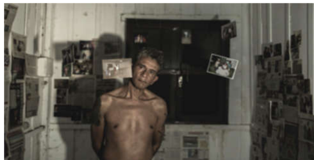
Pobre Preto Puto

Sala Héctor Tosar, Auditorio Nelly Goitiño