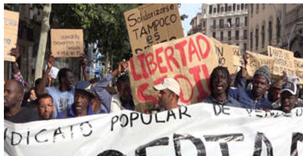
Nosotros, los negros